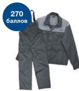
Униформа автослесаря и три пары перчаток