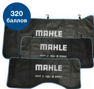
Комплект накидок на автомобиль